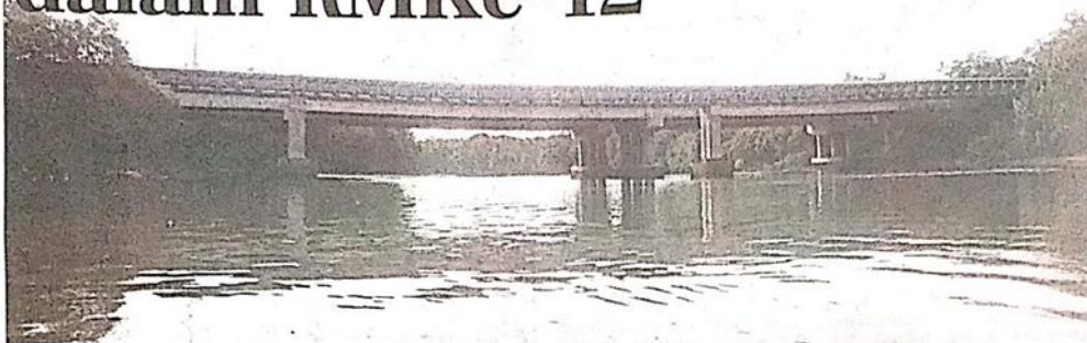
Lapisan minyak di muara Sungai Kim Kim, Pasir Gudang.