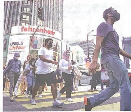
MEREKA yang berpendapatan RM2,208 sebulan kini dikategorikan sebagai miskin bandar.

"Bagaimanapun, setiap kali hujung bulan, saya terpaksa 'mengikat perut' kerana masalah kewangan. Wang simpanan sebelum ini juga hampir susut dan