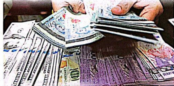
INFLASI yang berlaku di Malaysia pada masa ini adalah sesuatu yang sukar dielakkan kerana kenaikan harga barang adalah disebabkan fenomena di peringkat global.

"Oleh itu, kenapa ia berlaku (kenaikan kadar gaji sebenar) kerana 'hijab', inflasi dapat dikawal di Malaysia dan di negara lain kadar kenaikannya adalah rendah dan ada yang negatif kerana kadar inflasi yang tinggi dan tidak dikawal," katanya.