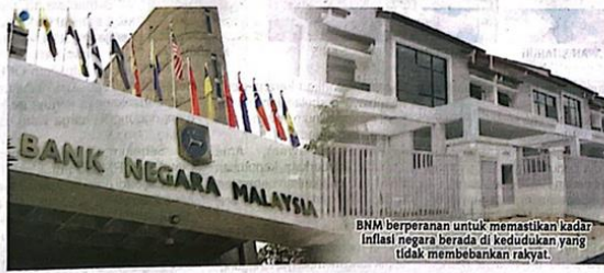
BNM berperanan untuk memastikan kadar inflasi negara berada di kedudukan yang tidak membebankan rakyat.

Di samping itu, orang ramai juga dinasihatkan untuk merancang kewangan bagi memanfaatkan lebih banyak peluang yang ada. Sekiranya kedudukan kewangan di luar kawalan, pemegang boleh berunding dengan bank atau mendapatkan bantuan daripada Agensi Kaunseling dan Pengurusan Kredit (AKPK) bagi membantu menyelaraskan semua kewangan anda.