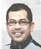
Profesor Jabatan Senibina Landskap, Kulliyah Seni Bina dan Reka Bentuk Alam Seldtar (KAED), Universiti Islam Antarabangsa Malaysia (UIAM)

Oleh Prof Dr Mohd Ramzi Mohd Hussain bhrencana@bh.com.my