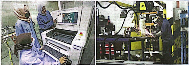
PERKEMBANGAN ekonomi Malaysia pada S2 2023 disokong peningkatan dalam sektor pembinaan, perkhidmatan dan pembuatan.

Separuh pertama 2023 catat pertumbuhan 4.2 peratus dengan permintaan domestik jadi tulang pengembangan ekonomi