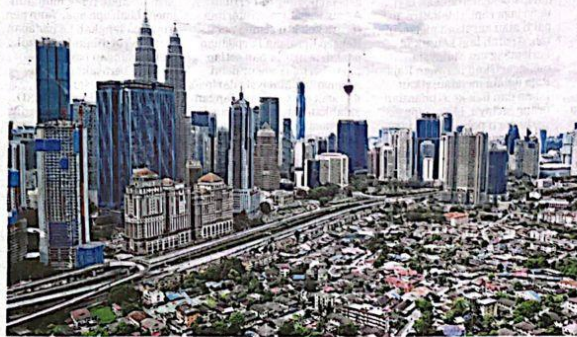
Ekonomi Malaysia mampu berdaya tahan dalam mendepani keadaan pasaran global yang mencabar. (Foto hiasan)

Sektor pembinaan mencatat kadar pertumbuhan tertinggi, iaitu sebanyak 6.2 peratus diikuti dengan sektor perkhidmatan (4.7 peratus) dan sektor pembuatan