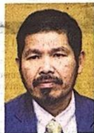
Mohd Uzir Mahidin

Mohd Uzir berkata, walaupun berdepan dengan cabaran global, struktur ekonomi Malaysia yang pelbagai dan asas yang kukuh telah menyokong pertumbuhan ekonomi yang stabil.